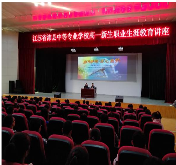
职业生涯规划讲座

落实跳一跳够得着的小目标,在“确定发展目标”后,就必须“构建发展台阶”,其中第一个台阶,即近期目标的规划尤其要具体、明确。要围绕发展目标对整个中职学习阶段如何学习、生活等方面进行全过程规划,明确自己每年、每个学期甚至每周、每日应该做什么、如何做,从而建立起适合自我发展、自我完善的目标体系,并在教师的协助下有计划、有步骤地实施。对中职生来说,要特别强调“跳一跳,够得着”的小目标。只有在中职生能力范围之内,又具有一定挑战性的目标,才能有最佳的动机激发作用,而当目标实现时又能使学生获得效能信息,提升自我效能感。