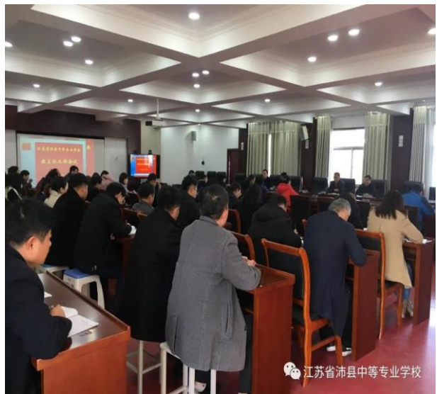
学校安全工作会议