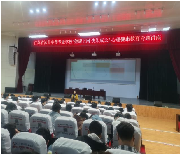
心理健康教育讲座